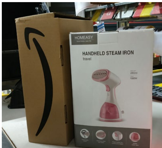
Rycina 5: Żelazko podróżne