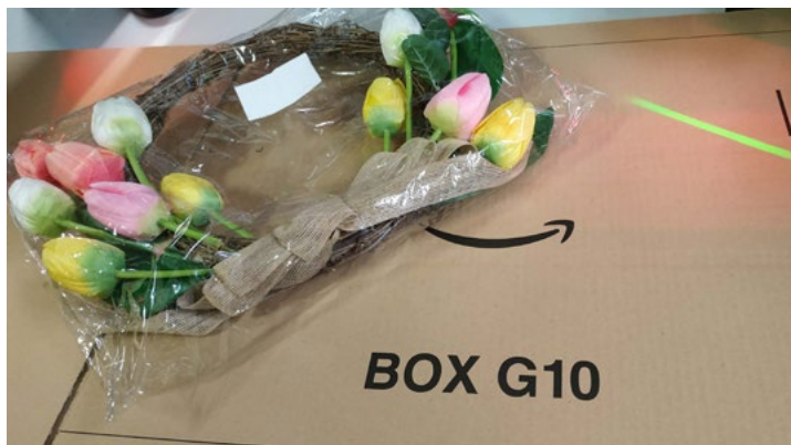
Rycina 3: Sztuczny wieniec tulipanowy