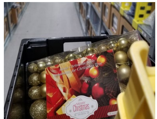
Rycina 4: Ozdoby świąteczne