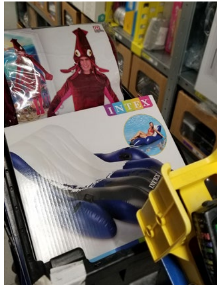
Ryc. 2: Kostium kałamarnicy, krzesło basenowe